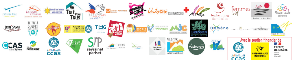
Illustration : corbac40

Retrouvez les points de collecte sur : www.planning-familial.org/fr/le-planning-familial-de-lisere-38